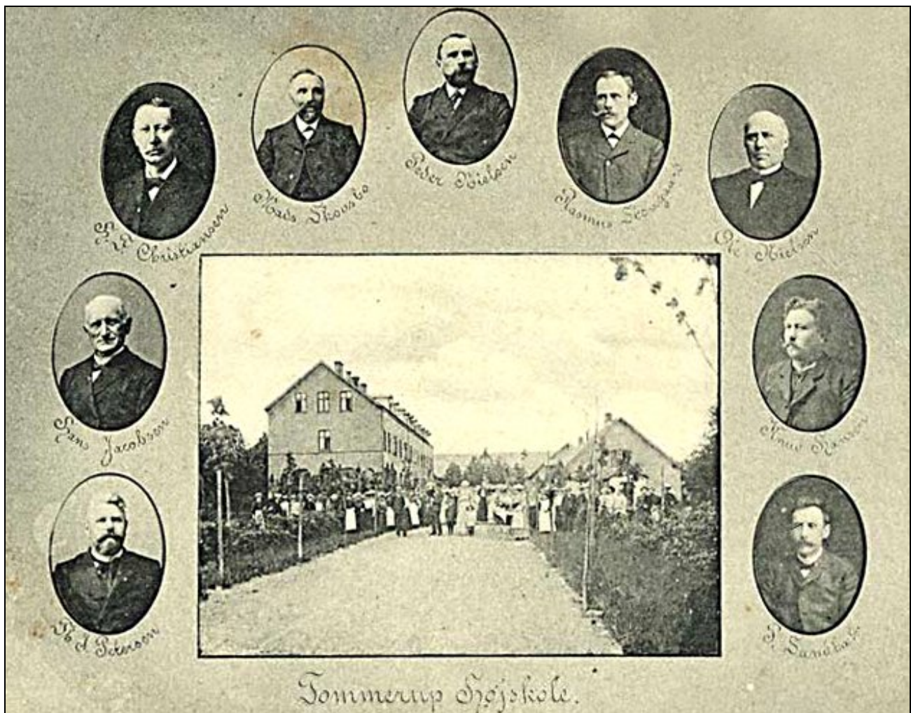
Mændene bag oprettelsen af Tommerup Højskole. Efter postkort afsendt 1909.