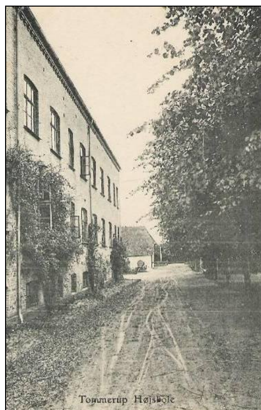
Det tidligere drengeshjem, nu højskole. Efter postkort afsendt 1909.

eller hvad de nu hed, til disposition. Og hvor turen gik til et eller andet udflugtssted, hvor der også var mulighed for udendørs sysler så som "To mand frem for en enke", "Klap ud" eller "Tyv ja tyv det skal du være," mens forældrene lejrede sig på medbragte plaider og så til. Til andre tider foregik det på præstegårdens plæner, måske med en andagt i kirken først. Megen rød og gul sodavand er tyllt ned til den medbragte kringle og sandkage. Tjah, minderne har man da lov at ha!" Næsten 6 snese år er gået siden Indre Mission begyndte sit børnearbejde i sognet. I dag eksisterer søndagsskolen som sådan ikke mere, men som en slags forsættelse er der i dag en lille klub for børn under betegnelsen 1313-klubben (Børnenes bibelklub), der samles hver mandag eftermiddag.